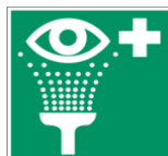
Prysznic do przemywania oczu